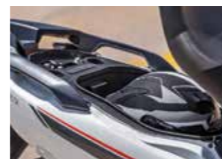
Για την κατηγορία των σπορ μεσαίων scooter ο χώρος κάτω από τη σέλα είναι επαρκής

Ο σύγχρονος κινητήρας Euro 5 του M310 είναι πραγματικά πολύ δυνατός και εύστροφος, προσφέροντας επιδόσεις που δύσκολα θα βρεις σε άλλο scooter με λιγότερα από 400 κυβικά