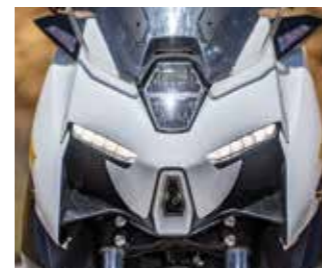
Εξωγήινη αισθητική για την μούρη του M310 με τα full-led φώτα να έχουν πολύ καλή απόδοση

Ο σύγχρονος σχεδιασμός τετραβήβιδος, υγρόψυκτος κινητήρας 309cc του M310, αποδίδει κορυφαία ιπποδύναμη για την κατηγορία, με 33,3 ίππους και ροπή στα 3,2kg/m προσφέροντας πολύ υψηλές επιδόσεις και σπορ χαρακτήρα στο M310. Και εδώ ο αναβάτης μπορεί να επιλέξει ανάμεσα σε δύο προγράμματα λειτουργίας, (ECO/Sport), όπου στο ECO η χαρτογράφηση της ECU μπορεί να περάσει αυτόματα στο Sport στις 7.000 στροφές αν ο αναβάτης ανοίξει τέρμα το γκάζι. Η τελική