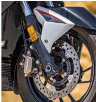
Ισχυρά φρένα με δικάναθο ABS της Bosch εμπρός και πίσω

ροι ανταγωνιστές (σε κυβικά και όχι σε τιμή) προσφέρουν χώρο για δύο μεγάλα κράνη. Με την τιμή των 4.595€ να είναι στο κάτω άκρο της κατηγορίας, αλλιώς με τον εξοπλισμό και τις επιδόσεις να βρίσκονται στο επίπεδο των πολύ ακριβότερων mega-scooter, το M310 βάζει "με το δεξί" την Zontes σε ένα νέο πεδίο δράσης, όπου στην χώρα μας αποτελεί την πιο δημοφιλή εμπορικά κατηγορία.