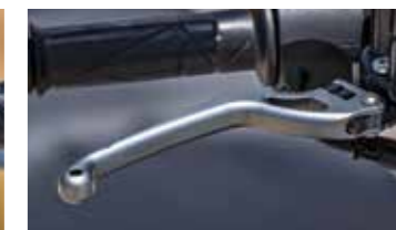
Οι ρυθμιζόμενες μανέτες προσθέτουν άλλον ένα πόντο στην άριστη εργονομία της θέσης οδήγησης του M310