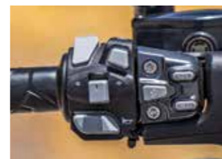
Τα πάντα στο M310 ρυθμίζονται με το πάτημα ενός κουμπιού και υπάρχουν συνολικά 17!