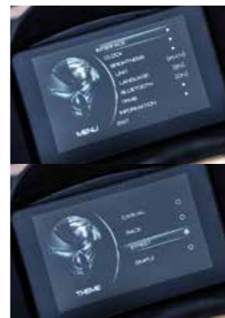
Η έγχρωμη οθόνη TFT έχει δυνατότητα σύνδεσης smartphone μέσω Bluetooth, τέσσερα διαφορετικά γραφικά απεικόνισης και ρυθμιζόμενη φωτεινότητα